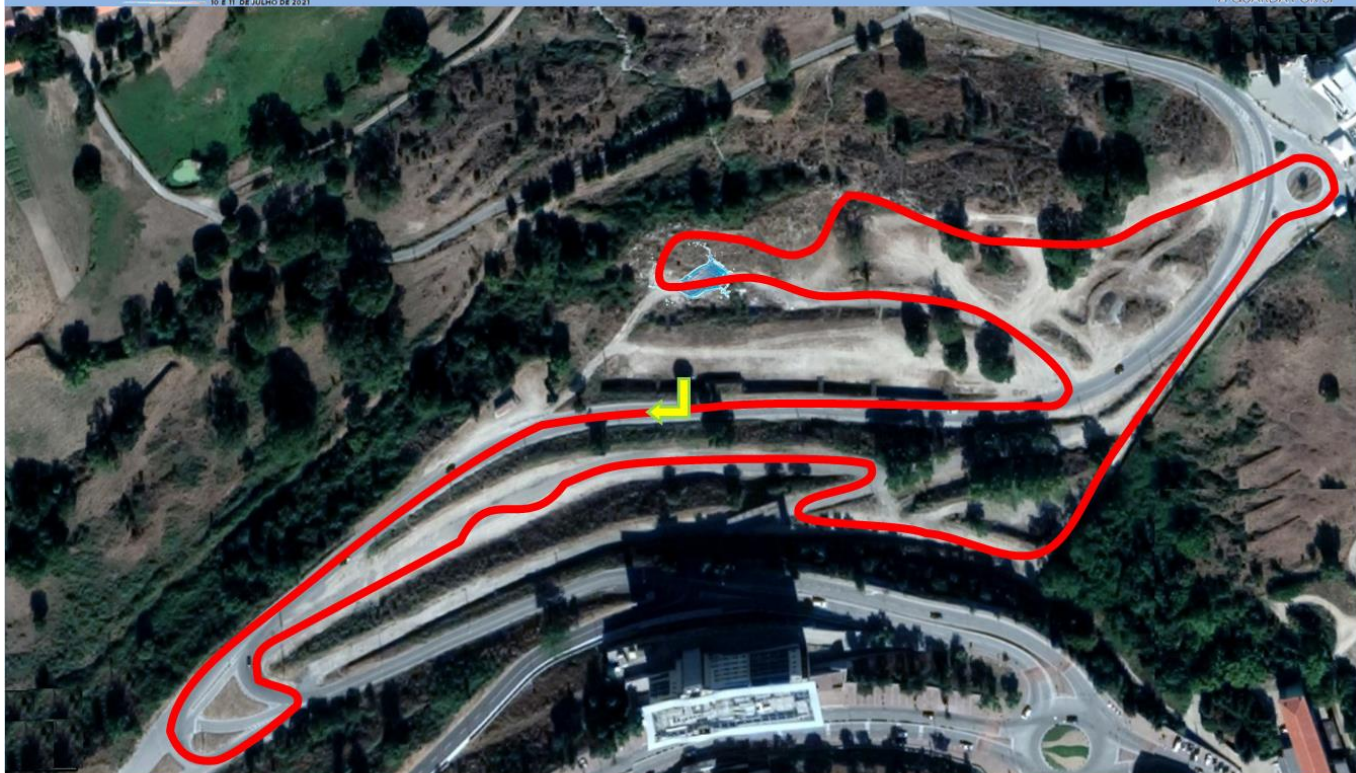
Descrição do Percurso