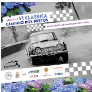
CLASSICA CAMINHO DOS PRETOS 21.png 1590K