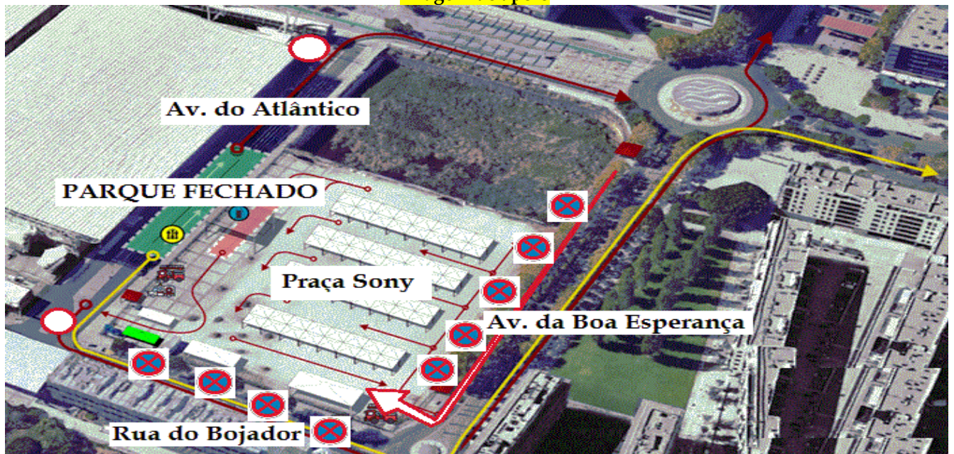
Imagem de apoio