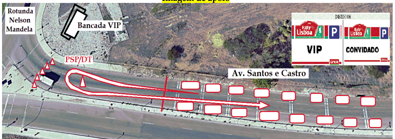
Imagem de apoio

AV. SANTOS E CASTRO (Sentido descendente) alguns metros antes da Rotunda Nelson Mandela – Após o encerramento da Av. Santos e Castro, criar uma zona de parque para os convidados, conforme imagem de apoio. Os veículos devem ficar estacionados de forma a poderem contornar os cones e regressar em contramão até ao Eixo Norte/Sul, por onde acederam.