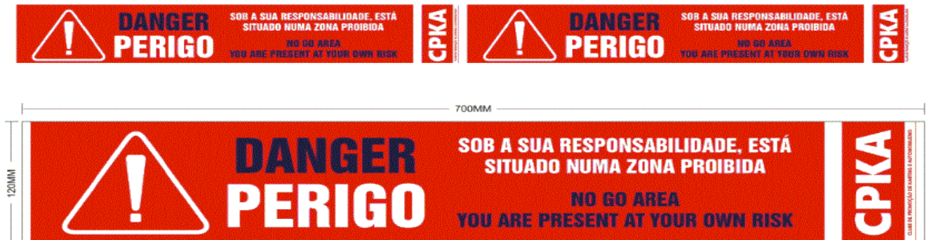
Imagem de apoio