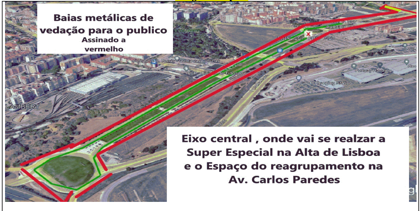
Imagem de apoio