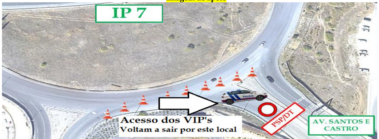
Imagem de apoio