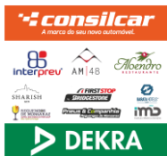
Placa n.º 5 (50x52cms)