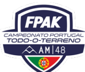
Placa n.º 4 (13x15cms)