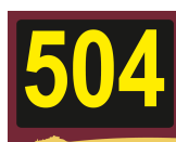
Placa n.º 1 (15x19cms)