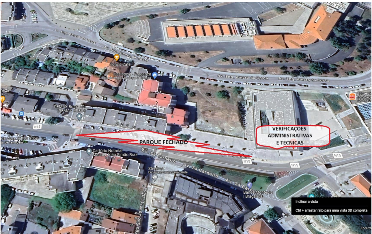
18.4 - Verificações Técnicas / Parque fechado