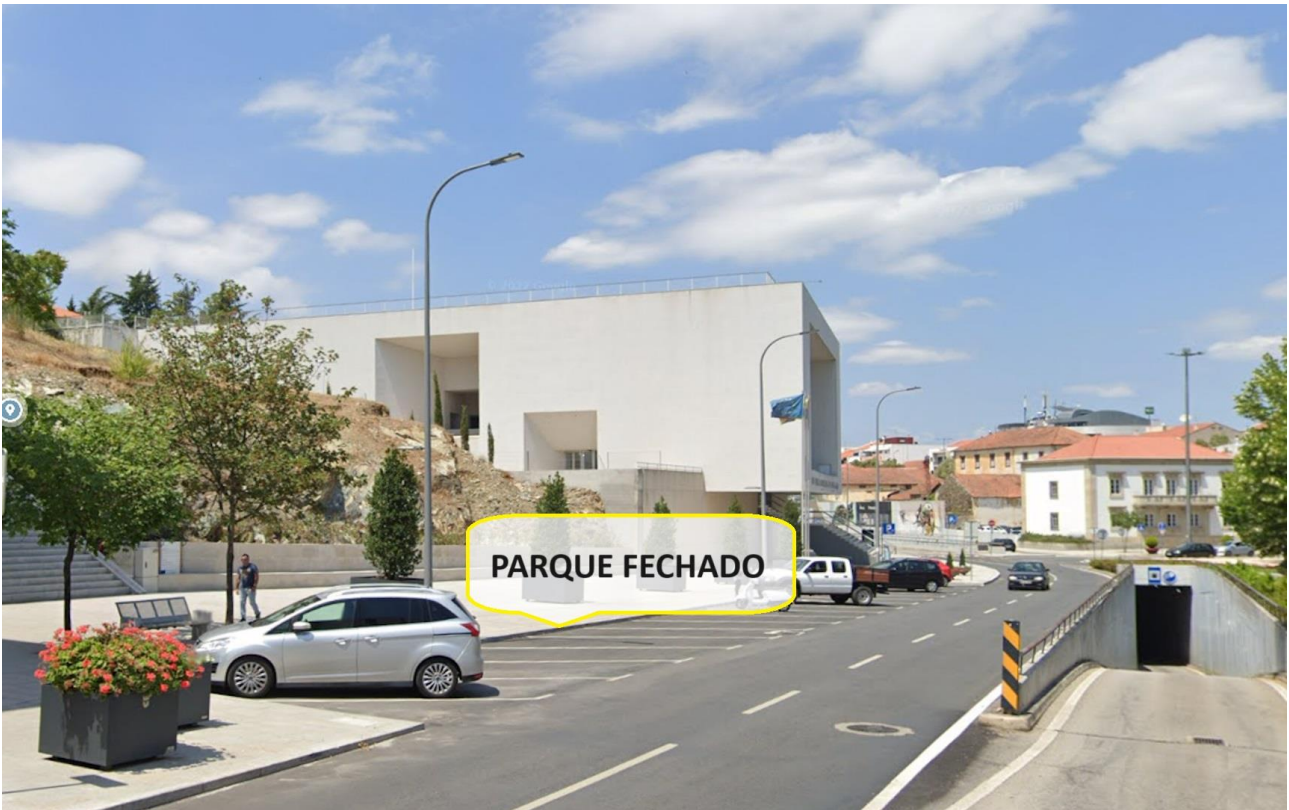
18.6 – Parque Assistência Trial 4x4 - Heat Of The Mountain + Secretariado