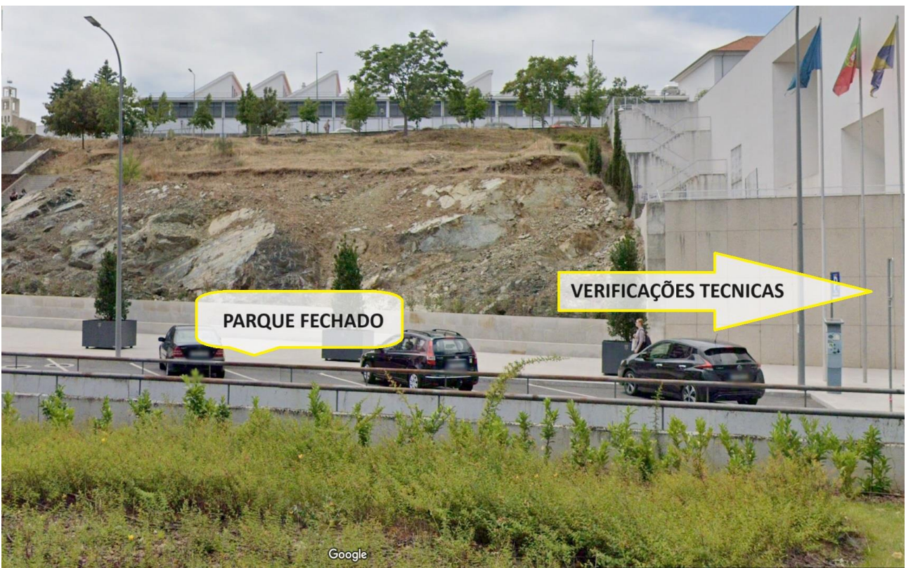
18.5 - Parque fechado