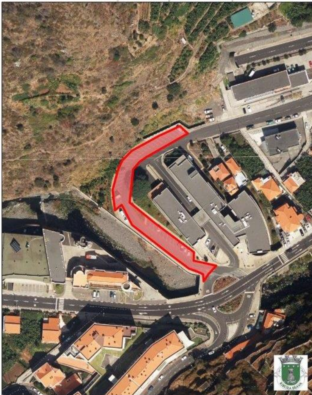
Planta de Localização - Ortofotomapas