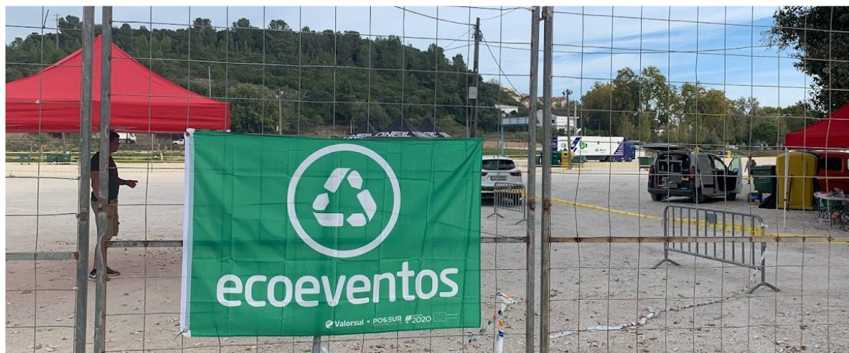
Atribuição do título de Ecoevento