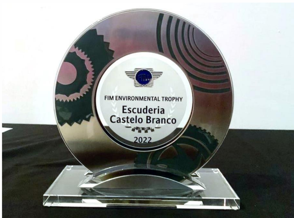
Atribuição Prémio Internacional FIM