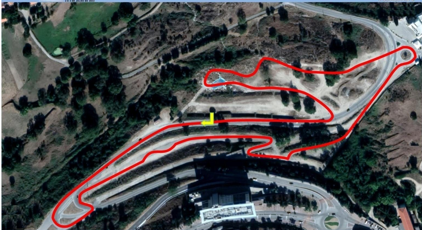
Descrição do Percurso