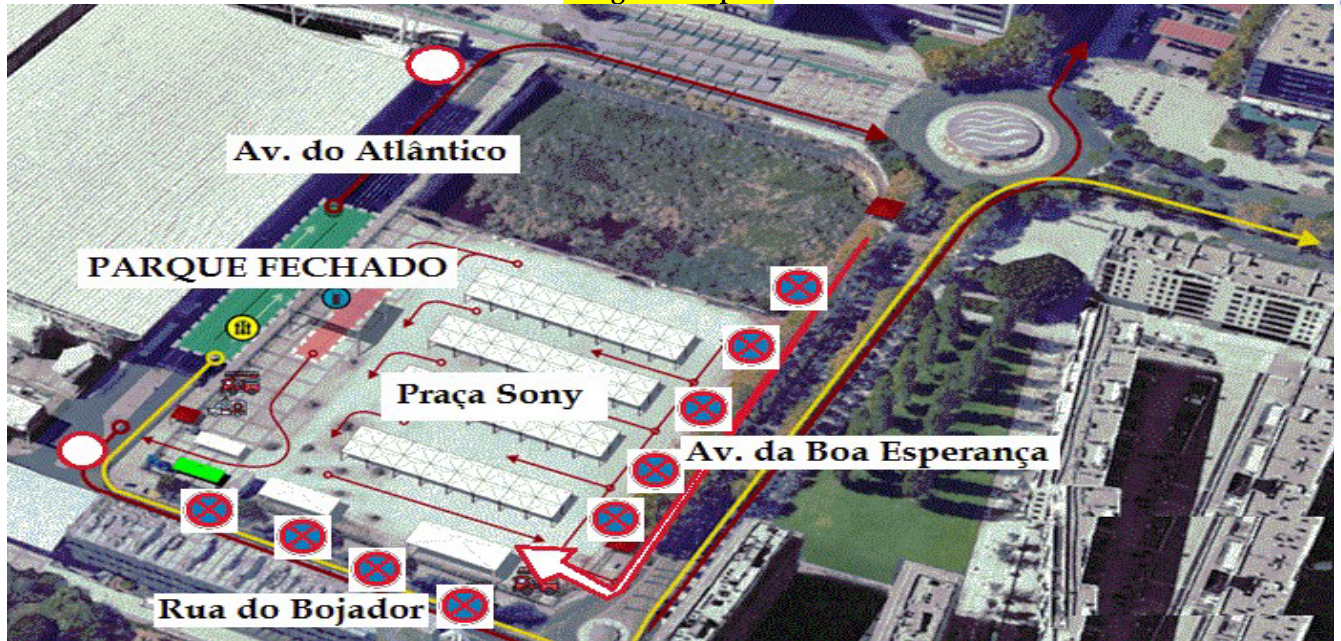
Imagem de apoio