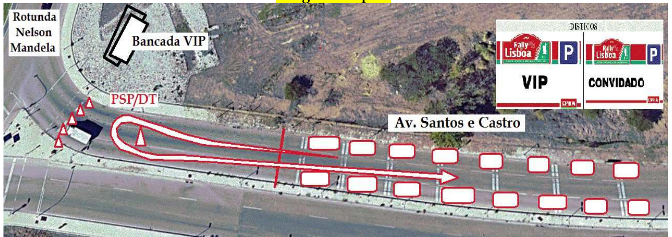
Imagem de apoio

AV. SANTOS E CASTRO (Sentido descendente) alguns metros antes da Rotunda Nelson Mandela – Após o encerramento da Av. Santos e Castro, criar uma zona de parque para os convidados, conforme imagem de apoio. Os veículos devem ficar estacionados de forma a poderem contornar os cones e regressar em contramão até ao Eixo Norte/Sul, por onde acederam.