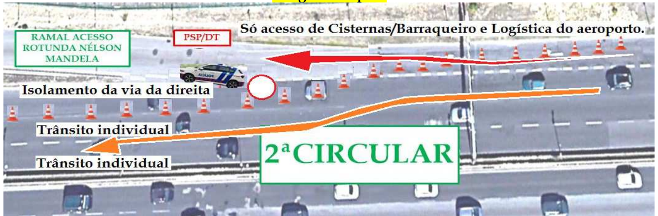
Imagem de apoio

CORTE DA VIA DA DIREITA - É obrigatório que a via da direita fique isolada por questões de segurança com cones, até depois do viaduto , de forma a evitar que o trânsito reduza a velocidade e olhe para a passagem de carros.