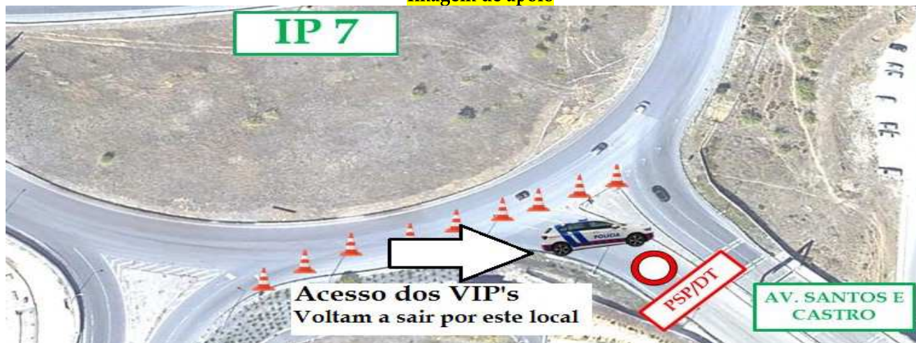
Imagem de apoio