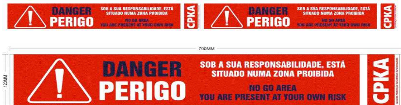
Imagem de apoio