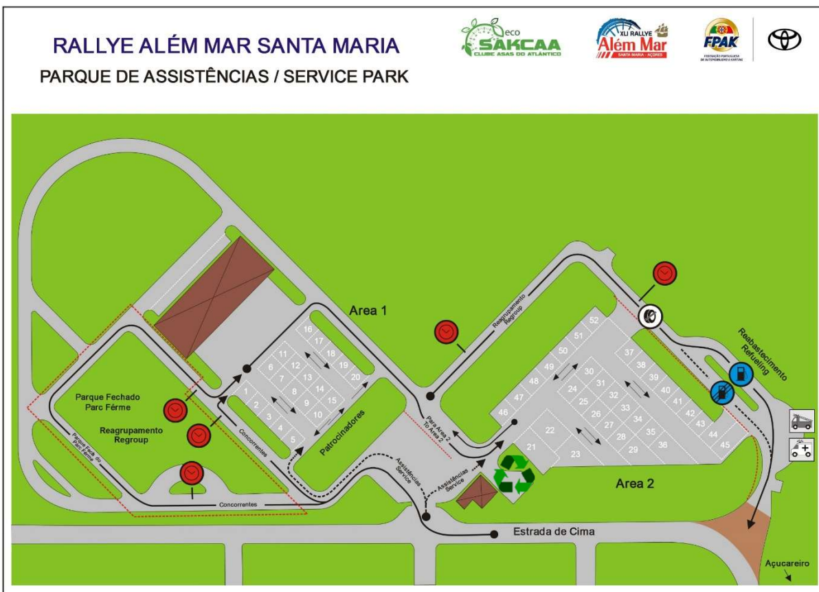
Figura 8: Mapa Geral da localização de recepção de resíduos no Parque de Assistência.