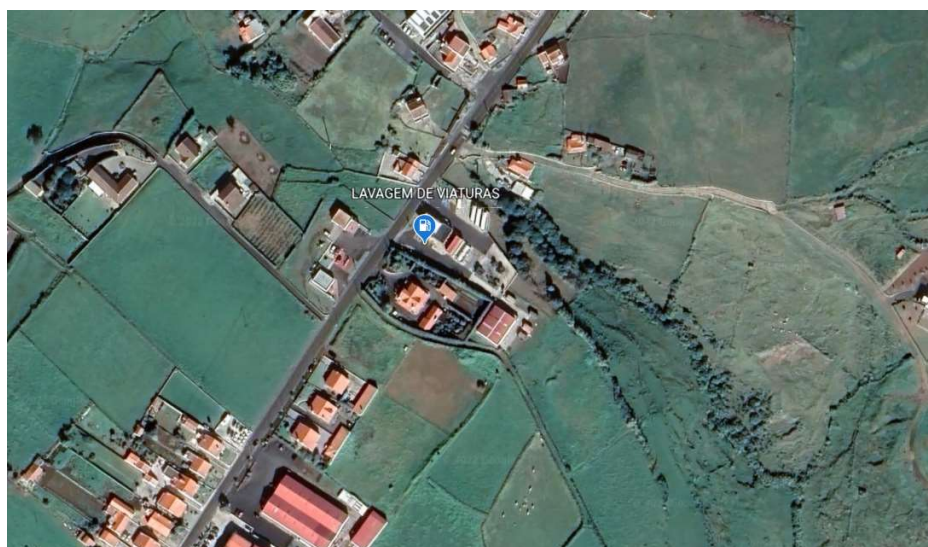
Figura 9: Localização do Posto de Abastecimento de Santa Maria J.H. Ornelas (36°57'55''N 25°08'00''W)

Para lavagem de viaturas é obrigatório a utilização da estação de lavagem de carros do Posto de Abastecimento de Santa Maria J.H.Ornelas, para um correto encaminhamento das águas, com separação de gorduras / hidrocarbonetos para evitar a contaminação de solo.