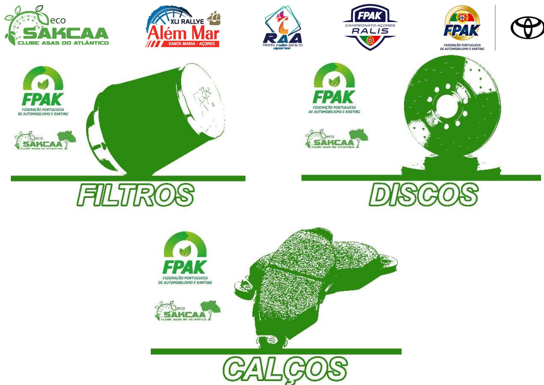
Figura 6: imagem a colocar nos contentores recetores de resíduos no Parque de Assistência.

- Spot's publicitários a sensibilizar o público sobre as novas medidas a implementar, na emissão da Rádio Clube Asas do Atlântico