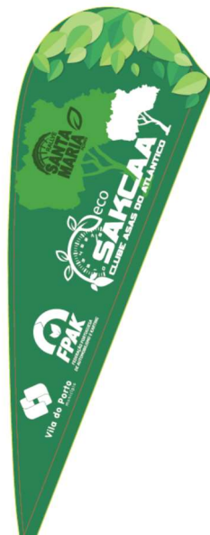
Figura 4: Design da Bandeira SAKCAA ECO.

- Bandeiras da SAKCAA ECO para colocação em áreas de público apelando assim à conduta ambientalmente sustentável.