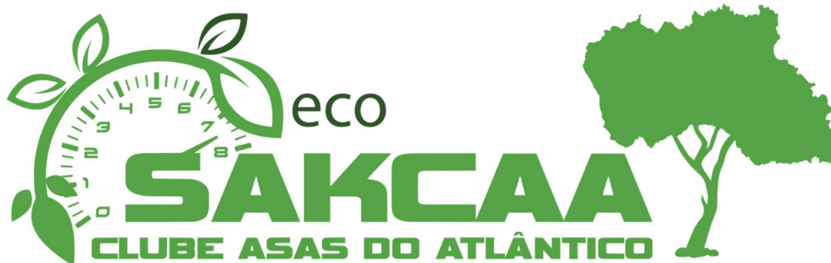
Figura 2: Logo SAKCAA ECO

O novo símbolo associa representação geográfica da ilha de Santa Maria como parte integrante de uma árvore, traduzindo a intrínseca importância para a ilha da prova Rally Além Mar Santa Maria, como toda e qualquer medida adotada em prol da sua proteção ambiental.