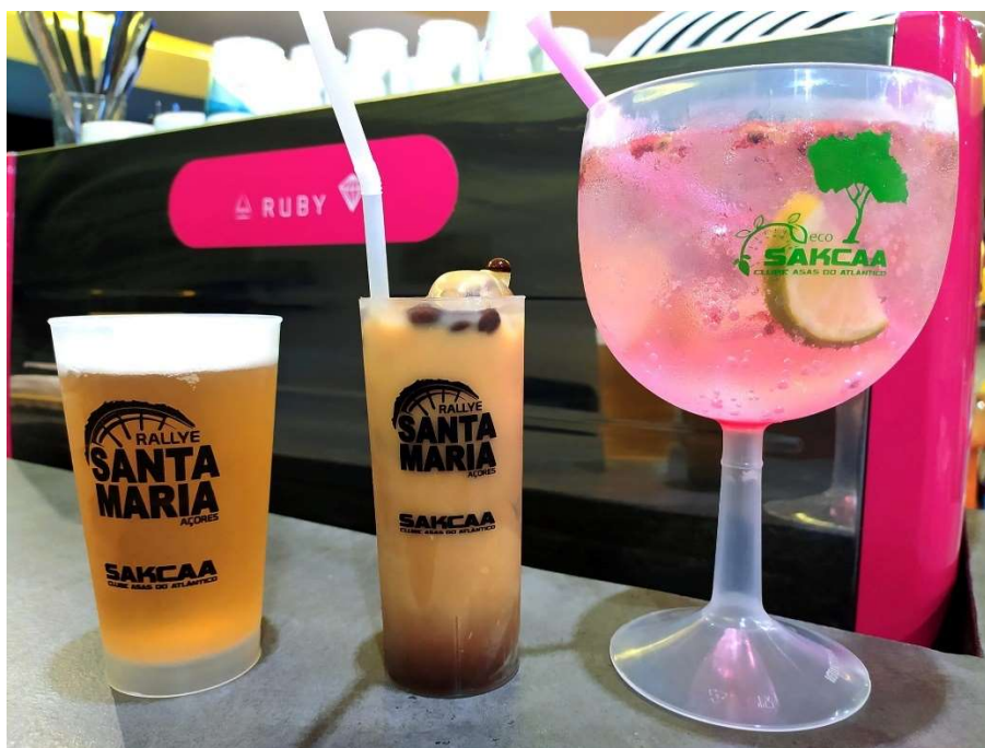
Figura 10: Copos reutilizáveis.

Durante todo o evento serão utilizados pelo Bar do Clube Asas do Atlântico copos reutilizáveis.