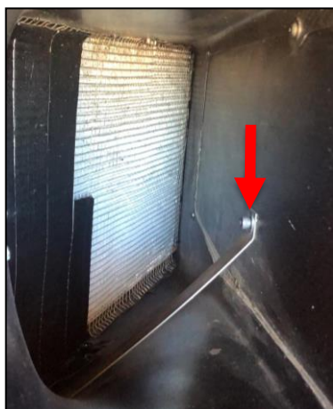
Imagen 1 / Figure 1