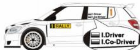
Ilustração 1 – Placas e números de Competição (art. 9 das PER 2021)